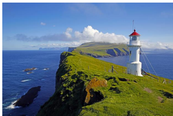
Leuchtturm auf Färöer

Mit den Färöern, Dänemark, Schweden, Norwegen, Åland und Finnland zeigt Corrado Filipponi die grenzenlose Schönheit Nordeuropas. Auch von der beliebten Hurtigruten wird berichtet. Der Reisefotograf verbrachte mehr als ein Jahr in den verschiedenen Ländern und verpackte das gewonnene Material an Fotos, Filmen und Geschichten in eine bildschöne und packende Live Reportage. Weitere Infos unter www.dia.ch/skandinavien .