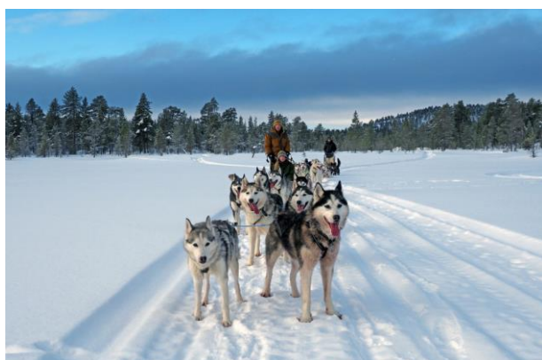
Huskygespann in Finnland

In seinem heutigen Beruf arbeitet er als Reisefotograf und Referent und hat so in über 30 Jahren 15 Live Film- und Fotoreportagen produziert und ca. 1000-mal für mehr als 200'000 Besucher in der Schweiz präsentiert.